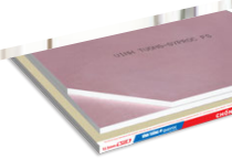
Tấm Thạch Cao Chống Cháy VĨNH TƯỜNG-Gyproc