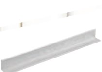
Thanh Viên Tường VTC 20/20